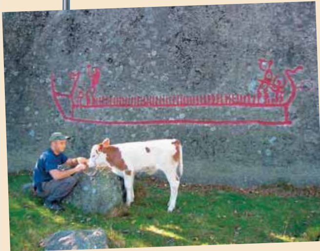
Fleckvieh bei den Wikingern!

Venja ist das erste Regio-Kalb in Norwegen!