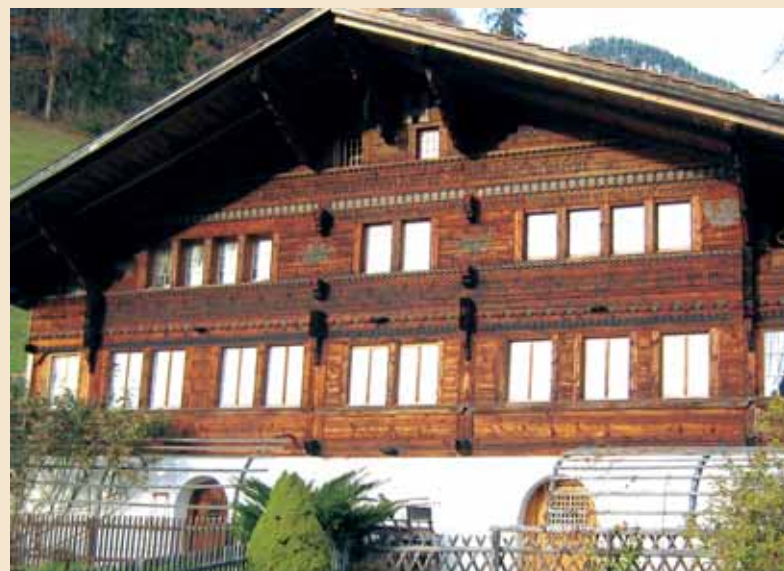
Typisches Haus im Simmental mit reichen Verzierungen und Sinnsprüchen.