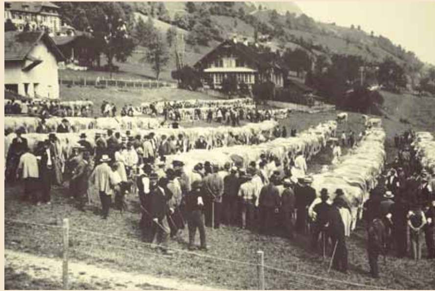
Die großen Viehmärkte in Erlenbach zogen Besucher von nah und fern, ja sogar aus dem Ausland an.

Das Zentrum der Simmentaler Viehzucht wurde Erlenbach im Simmental. Schon in früher Zeit war Erlenbach i.S. über die Grenzen des Bernerlandes hinaus bekannt wegen seiner Viehmärkte. Dies beweist eine im Jahr 1601 erschienene Schweizerkarte in italienischer Beschriftung. In dieser