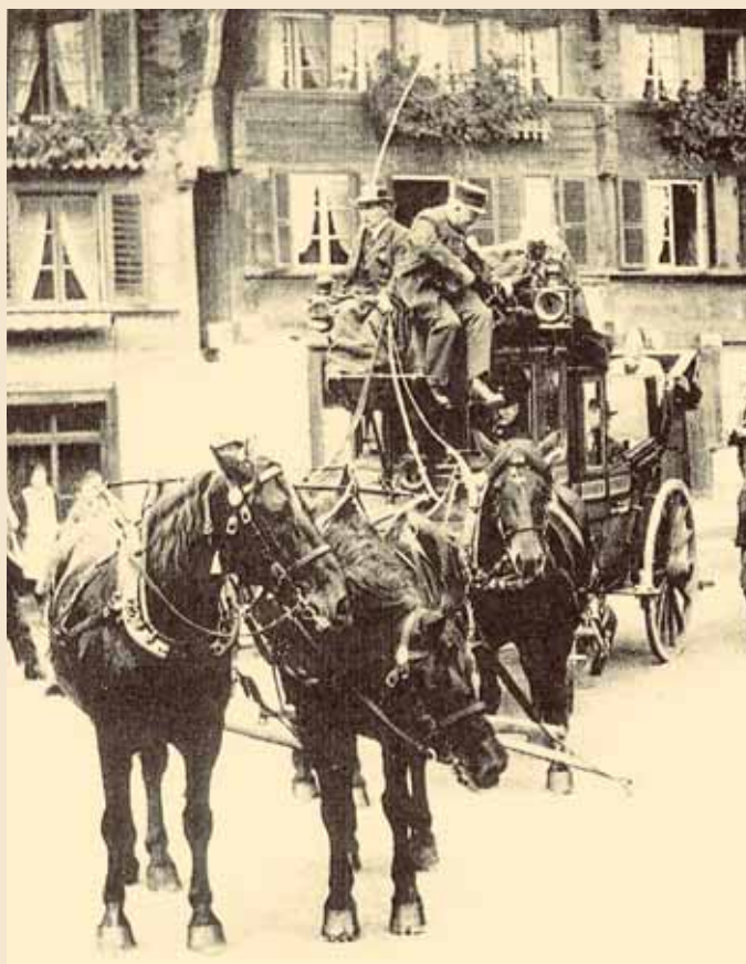
Schon bevor Erlenbach sich zum Zentrum der Rinderzucht entwickelte, war es für die Zucht der „Erlenbacher Pferde“ bekannt.