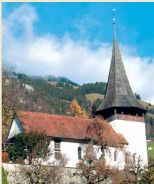
Die Dorfkirche von Erlenbach beherbergt wunderschöne Fresken aus dem 15. Jahrhundert.

und in der betreffenden Verordnung bestimmt: „Wenn die Fremden unser Vieh haben wollen, so mögen sie es wohl selbst holen“ (Noerner, 1893).