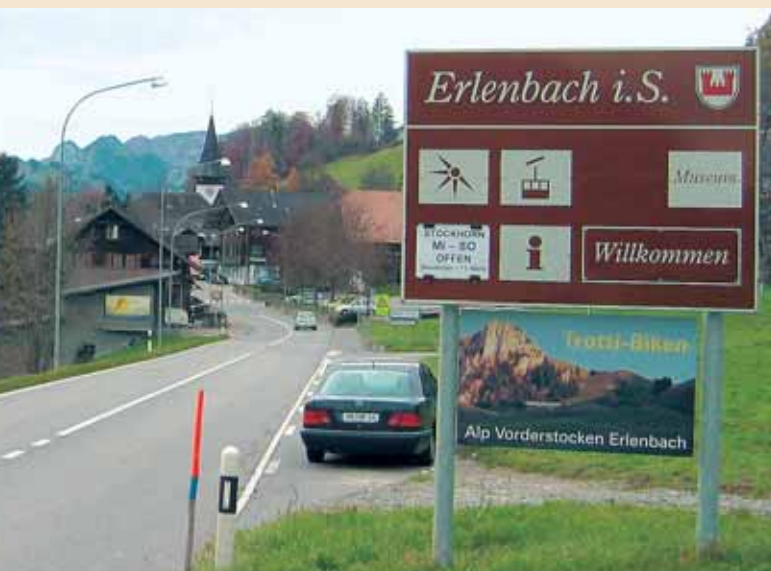
Erlenbach – das ehemalige Zentrum der Simmentaler Viehzucht.

Bereits Mitte des 18. Jahrhunderts war die Ausfuhr von Vieh aus dem Simmental sehr stark gewesen, so dass sich die damalige Berner Regierung genötigt sah, wegen allzu großer Viehausfuhr ein Ausfuhrverbot zu erlassen. 1797 wurde dasselbe aber wieder aufgehoben und der Viehhandel frei gegeben mit der richtigen Begründung: „Die Alpen machen die Kühe und nicht die Kühe die Alpen.“ Es wurde den Angehörigen des Landes aber verboten, das Vieh selbst auszuführen