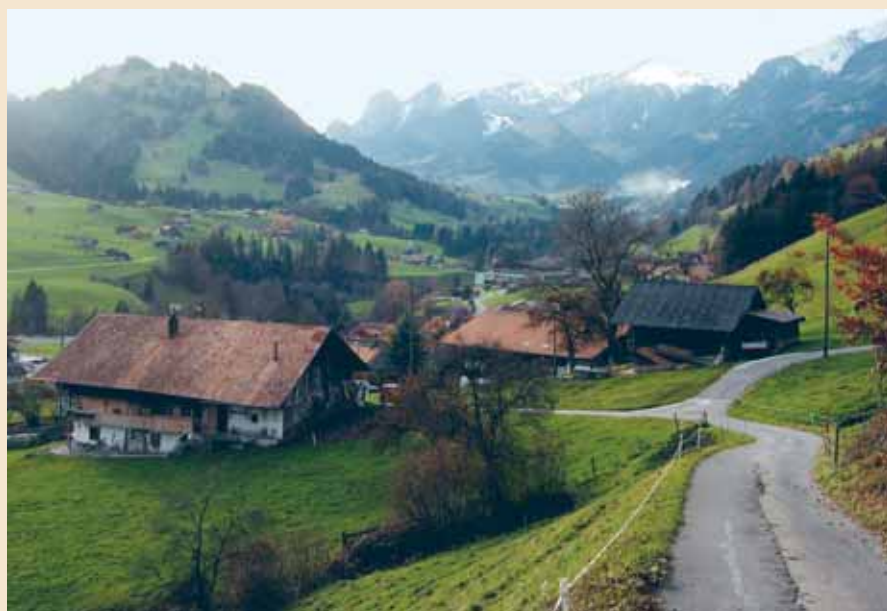
Das weltberühmte schöne Simmental hat der Rasse den Namen gegeben.