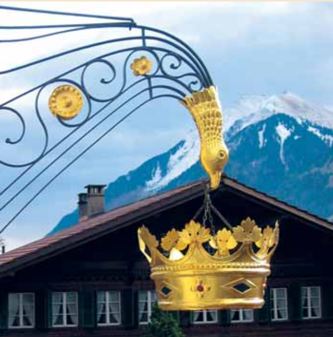
Auch heute noch weist eine goldene Krone auf den ehemaligen Gasthof „Zur Krone“ hin.