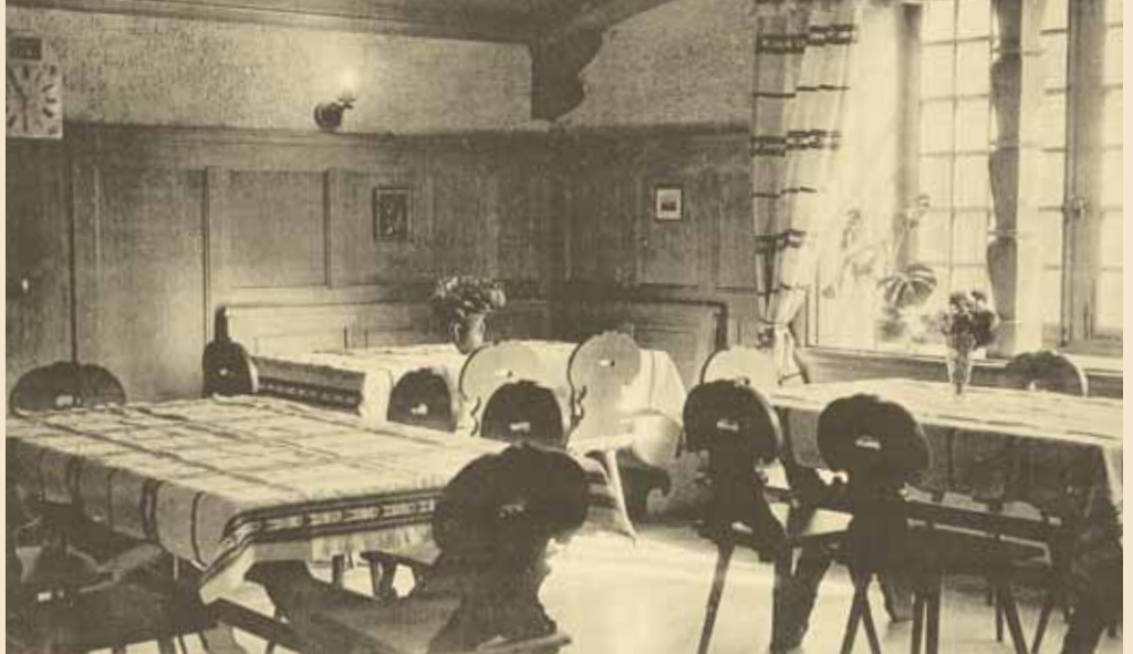
In der „Simmentalstube“ des Gasthofs „Zur Krone“ wurden Viehgeschäfte getätigt.