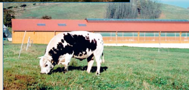
Neuer Wartebullenstall in Börnchen.