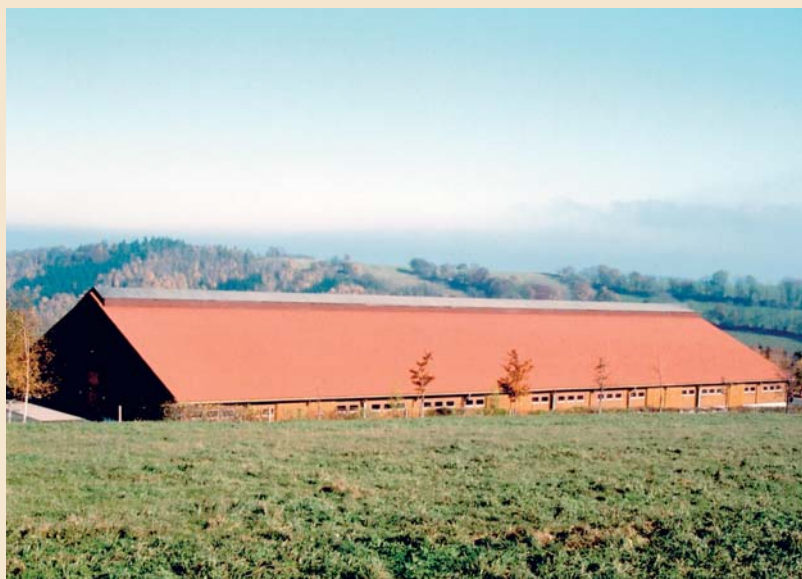
Börnchen – Wichtiges Standbein für harte, aber gesunde Wartebullenhaltung.

zeptieren. Wir wollen hier der „Modernität“ durch „konservative und immer noch gültige“ Zuchtziele begegnen.