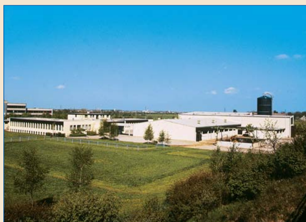
Station Grub – Ansicht von Südosten.

Zuchtverbände/Ordentliche Mitglieder: ZV Miesbach e.V., ZV Mühldorf, ZV Pfaffenhofen, RZV Traunstein; ZV Weilheim, RZV Vöcklabruck, Österreich, Genossenschaft Impuls, Tschechien; Fleckviehzuchtverband Südtirol, Italien; Ober- bayerischer Schweinezuchtverband